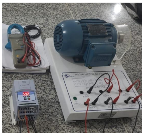
Figura 3: Motor em operação, com frequência sendo modulada através do inversor.