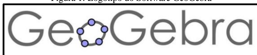
Figura 1: Logotipo do Software GeoGebra

De acordo com a figura 1, está disposto o logotipo do software propriamente dito, e na figura 2, está disposto um exemplo da sua aplicação.