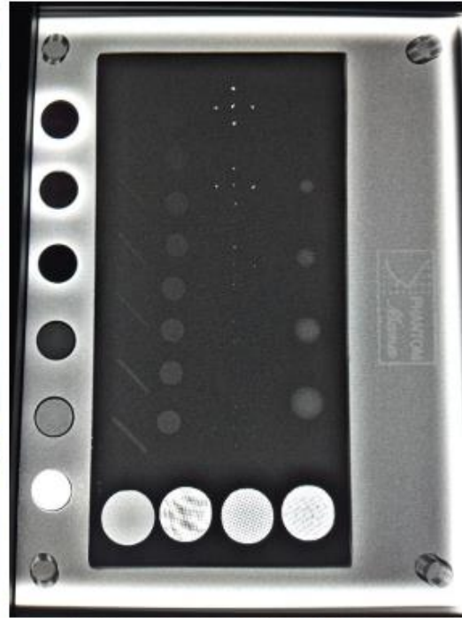
Figura 2: Padrão de imagem radiográfica ideal obtida com ferramenta específica de uma clínica localizada no DS Barra Rio Vermelho. Não há artefatos nesse padrão de imagem. Nesse caso, o padrão atendeu às normas sanitárias.