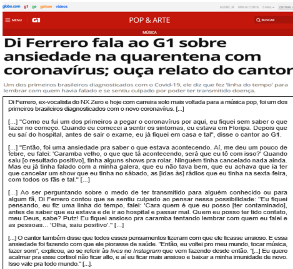
Figura 11 – Entrevista com Di Ferrero para o G1